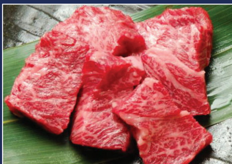
上ハラミ 【数量限定】